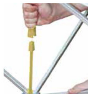
Assurez-vous que tous les connecteurs soient bien emboîtés.