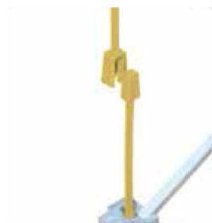
Ne pas soulever la structure par les connecteurs mais par le cadre.