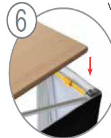
Positionnez la tablette sur la structure et l'étagère interne.