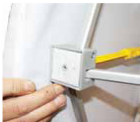
Fixation du visuel par velcro.