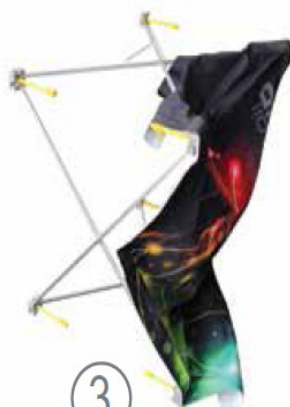
Visuel fixé sur la structure.