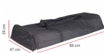
Sac de transport inclus.