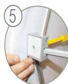
Fixez les retours du visuel sur les velcros.